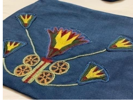
صورة رقم (٦) المنتج السادس

الوصف: حقيبة نسائية من قماش الجينز تم تطريزها باستخدام اسلوب التطريز الالبي في الوحدة الفرعونية ثم استخدام التطريز اليدوي بغرزة السلسلة بالألوان النبيتي والاخضر والاورنج واللبنى للربط بين الوحدات الفرعونية وازضافة يد سلسلة معدنية ذهبيه.