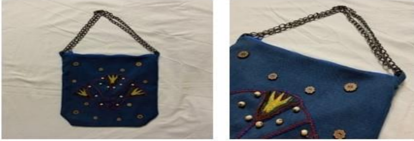
صورة رقم (٤) المنتج الرابع

الوصف: حقيبة نسائية من قماش الجينز، تم استخدام التطريز الآلي في الوحدة الفرعونية، وتم تنفيذها بغرزة الحشو بالألوان (الأصفر والأحمر والأخضر) كما تم استخدام التطريز اليدوي الذي يظهر في غرزة السلسلة باللون الأحمر والأزرق باستخدام خيط الكوتن بارليه.