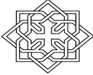
التصميم القبطي (٢٦)