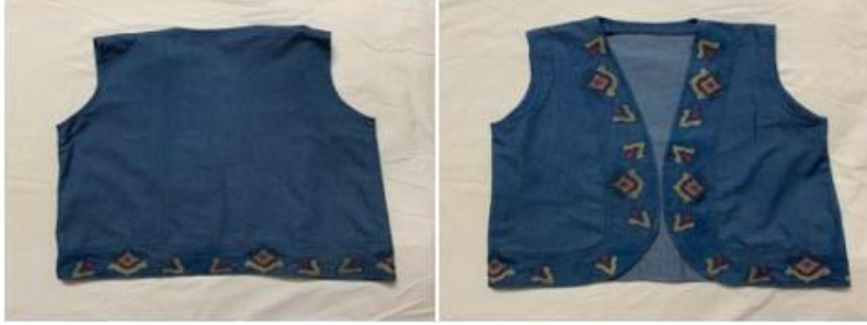
صوره رقم (١) المنتج الاول