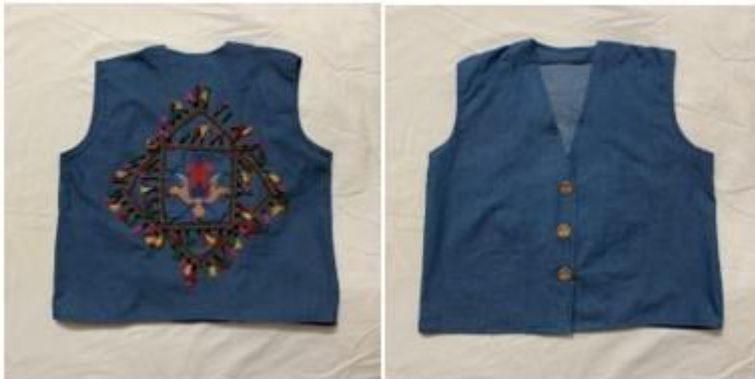
صورة رقم (٢) المنتج الثاني