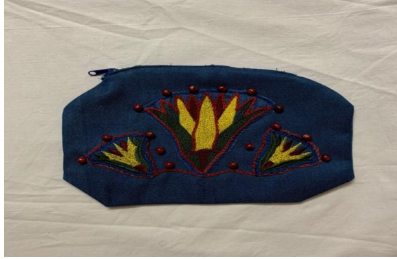
صورة رقم (٧) المنتج السابع

الوصف: بورتفيه من خامة الجينز تم تطريزه آليا ثم تطريز حدود الوحدات الفرعونية بالتطريز اليدوي والربط بينهم بغرزة السلسلة بالخيط الكوتون بورليه بلون نبيتي.