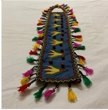
صورة رقم (٣) المنتج الثالث