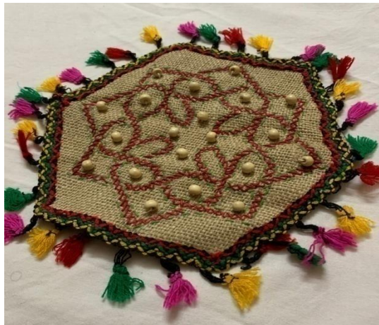
صورة رقم (٥) المنتج الخامس