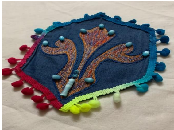
صورة رقم (٨) المنتج الثامن