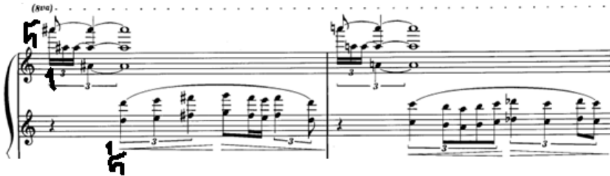
شكل رقم ( ٣ ) يوضح اداء اوكتاف هارمونى فى اليد اليسرى