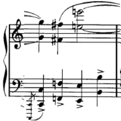
شكل رقم ( ٨ ) يوضح حلية الاتشيكاتورا