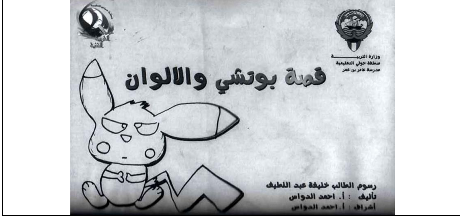
أسم القصة : بوتشي والالوان