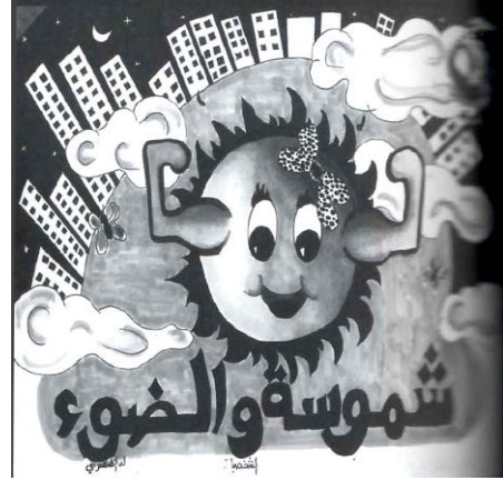
أسم القصة : شمسوه والضوء