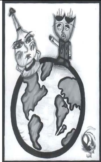
أسم القصة : ابو الطيب وماي الورد