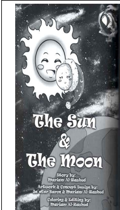
أسم القصة : The sun and the moon