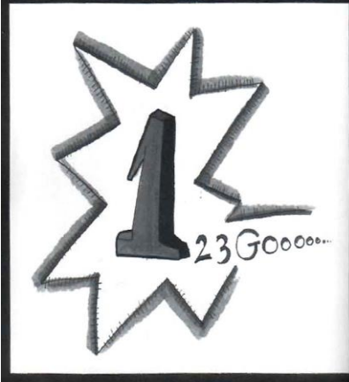
أسم القصة : سباق الارقام