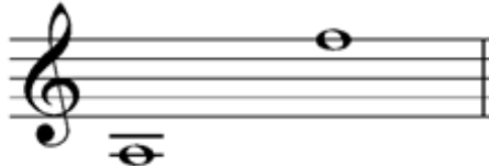
شكل (١٠) المساحة الصوتية للخانة الثالثة سماعي كرد الحسيني إبراهيم طامي