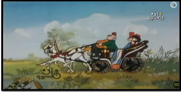
(شكل ٩) رسوم متحركة نزهة لمخرج الرسوم المتحركة أحمد سعد

https://www.facebook.com/groups/117873521577999/