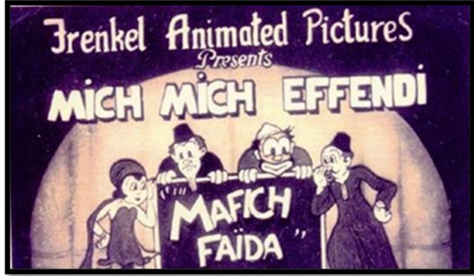
(شكل ١) "الشاطر مشمش"

"مشمش أفندي .. أول كرتون في العالم ينافس والت ديزني كان مصريًا بس "مفيش فايدة .. وصل عمره الآن إلى ٧٥ سنة .. وقاد حملات التبرع للدفاع الوطني .. اختارته تحية كاريوكا وصباح بطلا - اليوم السابع (youm7.com)