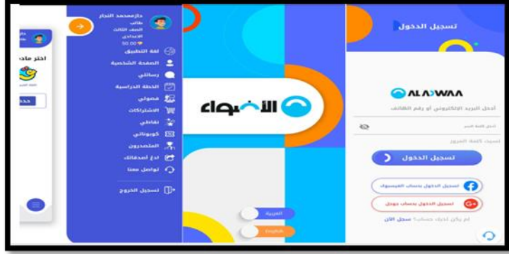
(شكل ٦) تطبيق المحمول لأعضاء لجميع المراحل الدراسية

https://www.aladwaa.com المنصة الأضواء الإلكترونية