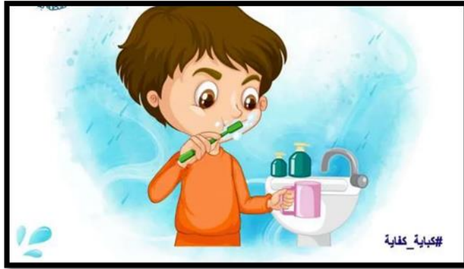
(شكل 8) توعية لترشيد المياه تحمل شعار كل نقطة بتفروق

كان لأستوديو "مهيب" دور في التعامل مع الجانب الإعلامي في إطار إعداد الدولة للمواطن مثل حث المواطن على كتمان الأسرار العسكرية، وتعامل مع سلوك الفرد وعلاقته بالمجتمع كاحترام "قواعد المرور"، "السائح كثرة قومية"، "نظافة البيئة"، "تجنب الضوضاء"، "محرارة التواكل والإهمال"، تحطيم كلمة "معلش". وربما كانت حملات تنظيم الأسرة هي أبرز القضايا التي أثرت في ثقافة ووعي المواطنين، فلم يقتصر تأثير تلك الإعلانات على الستينات أو الثمانينات فقط، ولكن امتدت لسنوات طويلة، حتى أثرت في أجيال مختلفة وثقافات متعددة. (وزارة الثقافة: صندوق التنمية الثقافية: ملتقى القاهرة الدولي للرسوم المتحركة الدورة الثالثة ٢٠٢٢)