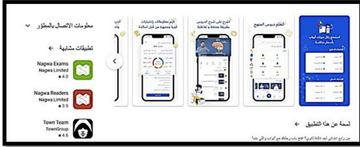
(شكل ٧) تطبيق أبواب

١- في حملات التوعية وفي مجال أفلام التوعية قام الفنان / عبد العليم زكى بعمل أفلام عديدة بالرسوم المتحركة لوزارة الصحة منها (فيلم الذباب . فيلم البعوضة) وحملات توعية عن النظافة وكذلك حملات توعية لرفع الوعي عند المستهلك السعودي لوزارة التجارة السعودية (إدارة حماية المستهلك). كما قام أيضاً بعمل وإخراج ثلاث أفلام توعية تجمع بين الرسوم المتحركة ذات البعدين والتصوير الحي سينمائياً لاستخدام حبوب تنظيم الأسرة وذلك لتوصيل رسالة إعلانية من خلال