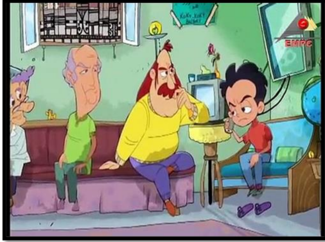
(شكل ١٠) سوبر هنيدي مسلسل كرتون بولييسي