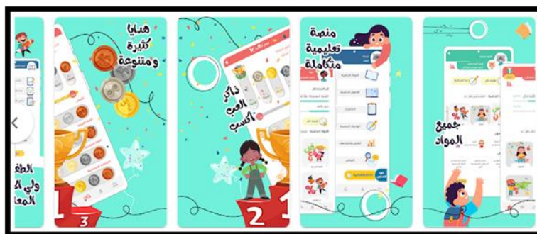
(شكل ٥) تطبيقات المحمول لكل من سلاح التلميذ الي الصف السادس الابتدائي

كما أن هناك تطبيقات المحمول لكل من سلاح التلميذ الي الصف السادس الابتدائي (شكل ٥) والأضواء لجميع المراحل الدراسية (شكل ٦) وتستخدم فيها الرسوم المتحركة والتقييم التفاعلي للطلاب وانظمة التحفيز بالنقاط.